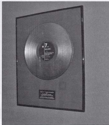
Ausgewählte Besonderheiten schmücken die Wände des Blasmusikarchivs: hier die Kopie der 7. Goldenen Schallplatte für Ernst Mosch und seine „Original Egerländer Musikanten“, im Original verliehen im September 1970 in Ulm/Donau.