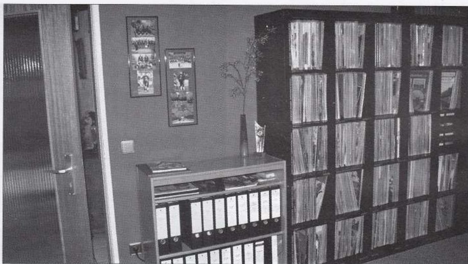
Ein Blick in die Archivräume: Hier lagern Tausende von Schallplatten, Musikkassetten und CDs mit Egerländer und böhmischer Blasmusik.

Nicht nur deshalb sollten wir nichts unversucht lassen, Volks- und Blasmusik aus der Heimat zu bewahren, zu pflegen und sie den nachfolgenden Generationen zugänglich zu machen.